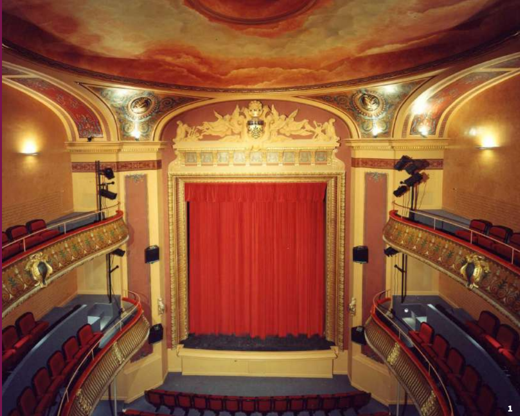
1 - Cadre de scène 2 - Le foyer

Le cadre de scène concentre une luxueuse décoration de moulures peintes. Au-dessus, au centre du fronton, deux anges portent les armes de la ville et des instruments de musiques agrémentent les extrémités.